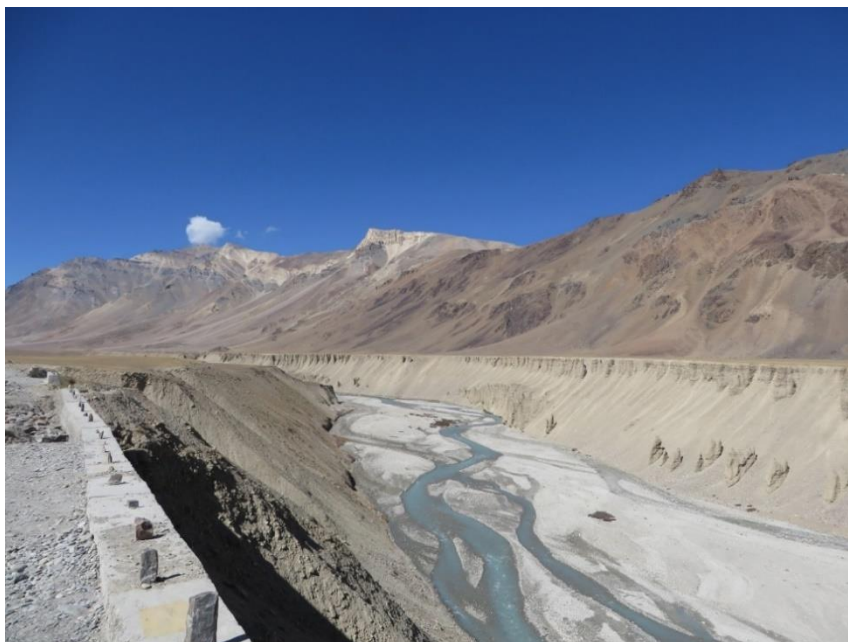
Foto 2: Beeld van Khardung La, de weg naar Ladakh, India.

Of een ander voorbeeld is het reizen door de Himalaya. Hier kun je prachtige reisverhalen over lezen en dat is allemaal waardevol. Maar om het reizen over de een na hoogste weg ter wereld, de Khardyng La (zie foto 2), zelf te ervaren moet je op reis.