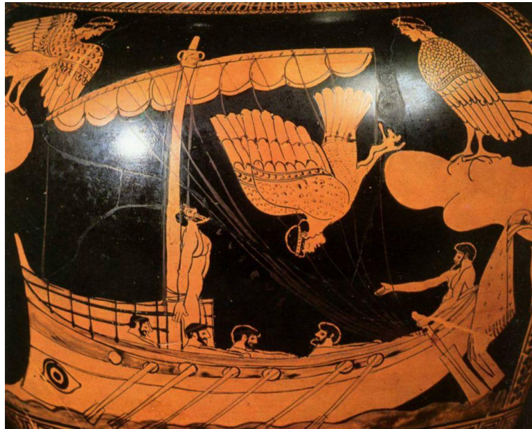
Figuur 4: Odysseus passeert de Sirenen.

Bij het in vervoering raken is het nog steeds belangrijk om gezond verstand te gebruiken. Dit blijkt wel uit een avontuur van Odysseus. Op advies van de Griekse tovenares Circe bij wie hij gedwongen heeft verbleven gebruikt hij namelijk een list om in vervoering te raken. Hij staat dan op het punt de Sirenen te passeren, maar weet van Circe dat dit een hachelijke zaak is: slechts weinigen overleven dit avontuur. Hij laat zichzelf dan ook vastbinden aan de mast om het gezang van de Sirenen te kunnen horen en in vervoering te raken (zie fig. 4) 3 .